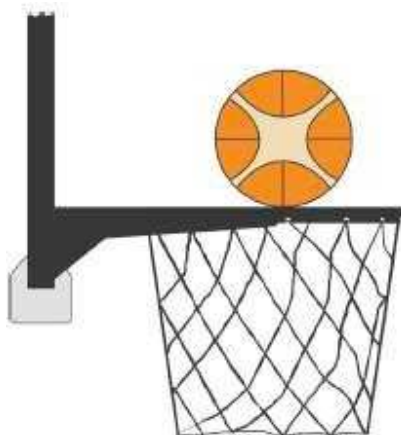
Figura 2 Palla a contatto con l'anello

31-15 Precisazione. Una violazione per interferenza è commessa da un difensore o da un attaccante durante un tiro a canestro su azione allorché un giocatore tocca il canestro o il tabellone, mentre la palla è a contatto con l'anello ed ha ancora la possibilità di entrare nel canestro.