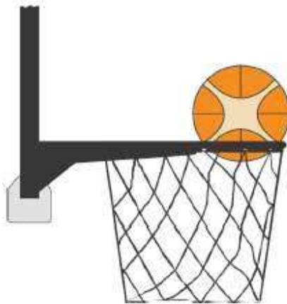
Figura 3 - Palla dentro il canestro

31-20 Precisazione. Si ha una violazione per interferenza se un giocatore difensore tocca la palla mentre questa è dentro il canestro.